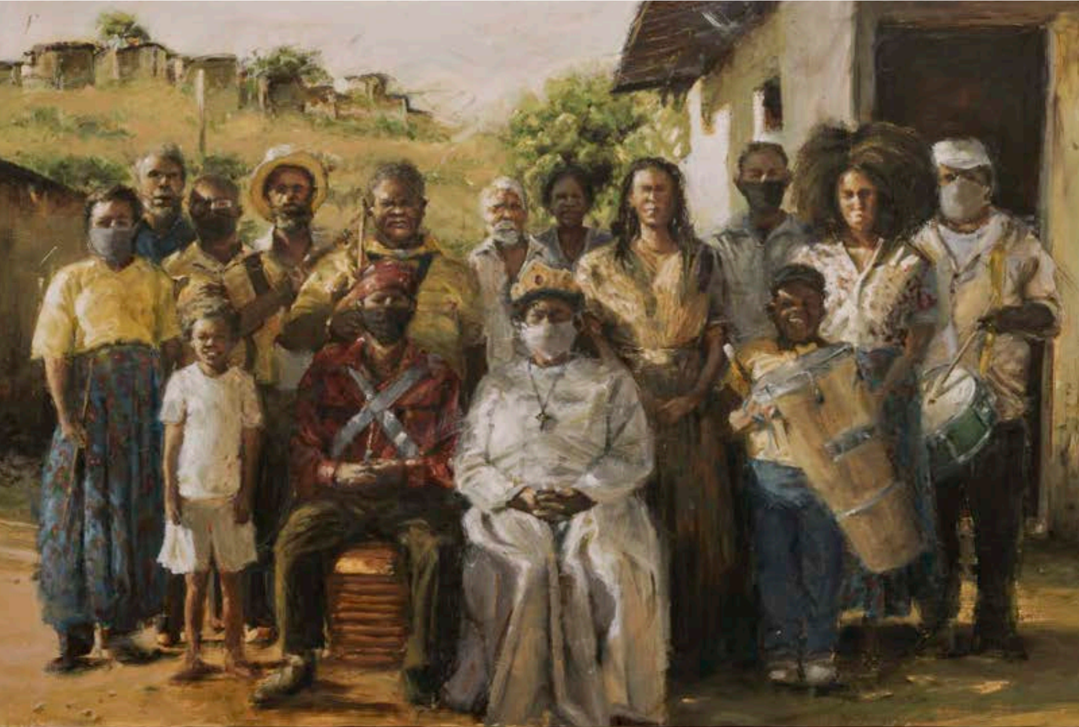
DIEGO MOURO PORTFOLIO