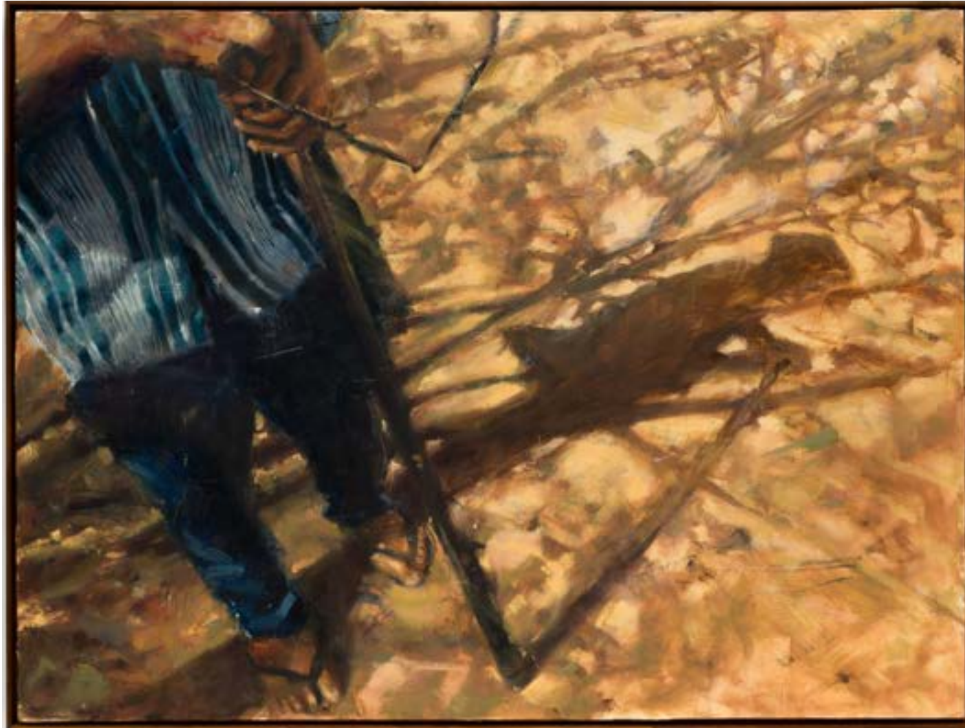
SEM TÍTULO, 2024 OIL ON CANVAS / ÓLEO SOBRE TELA 90 X 120 CM