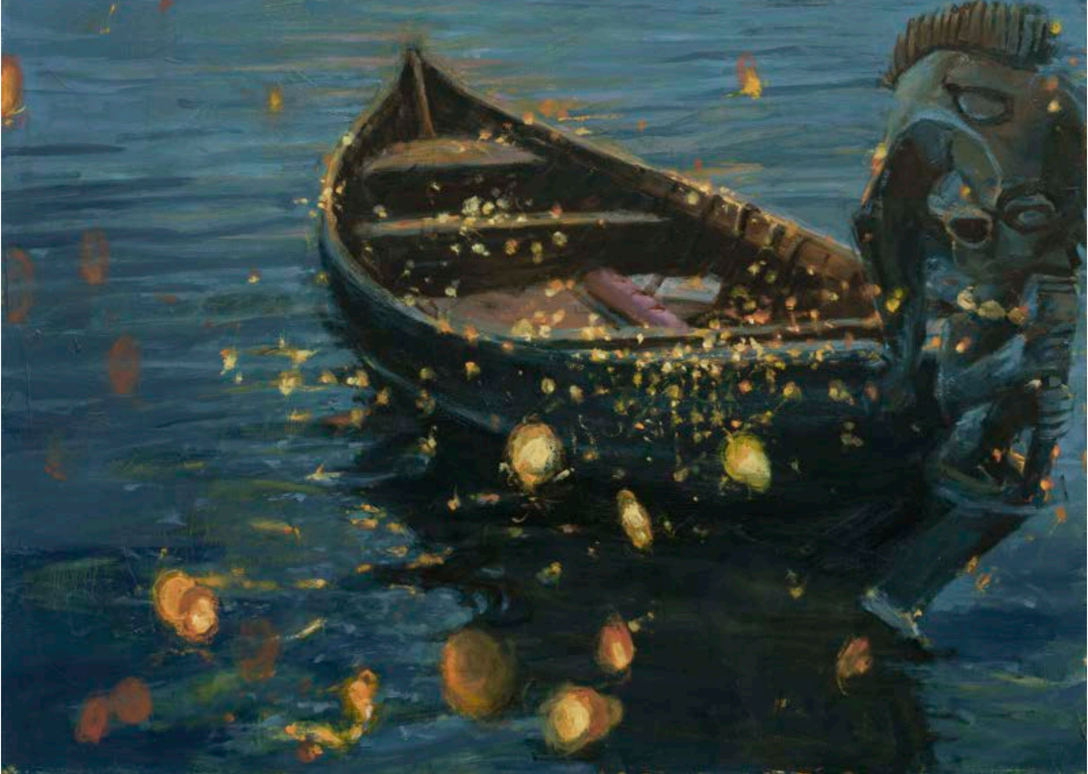
Selected Artworks / Trabalhos Selecionados