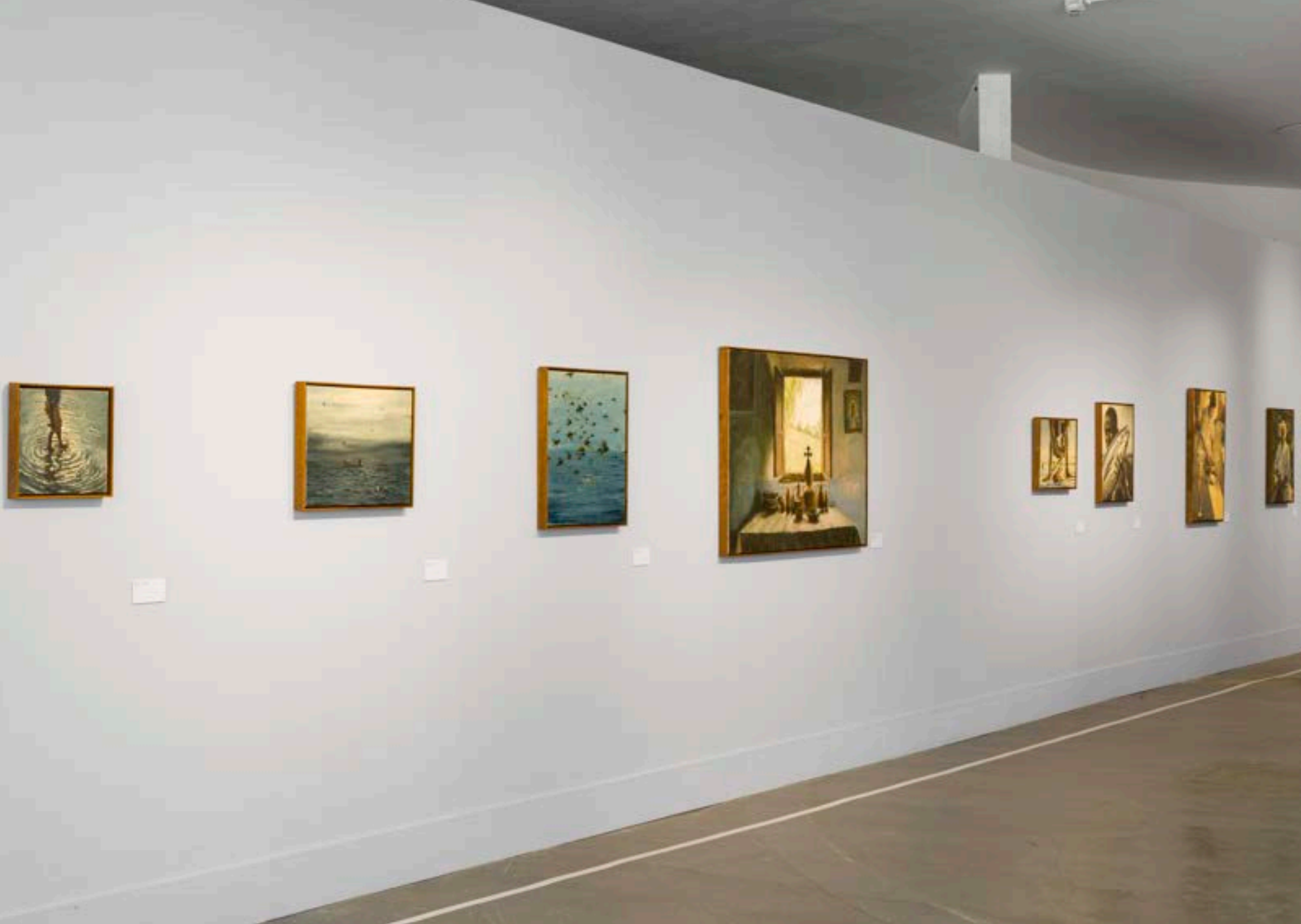
POVOADA: MUSEU AFRO BRASIL EMANOEL ARAÚJO, SÃO PAULO, 2023