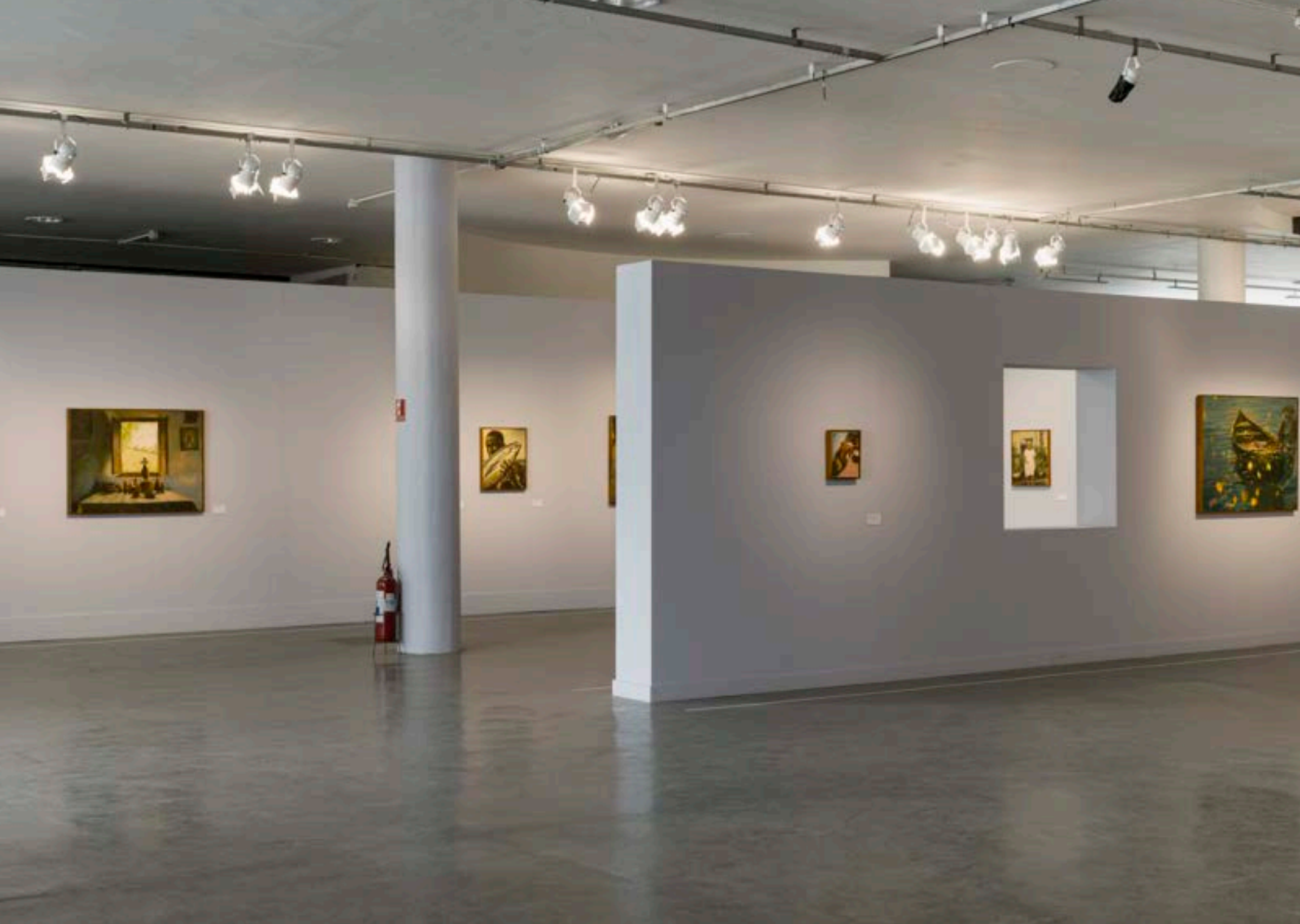
POVOADA: MUSEU AFRO BRASIL EMANOEL ARAÚJO, SÃO PAULO, 2023