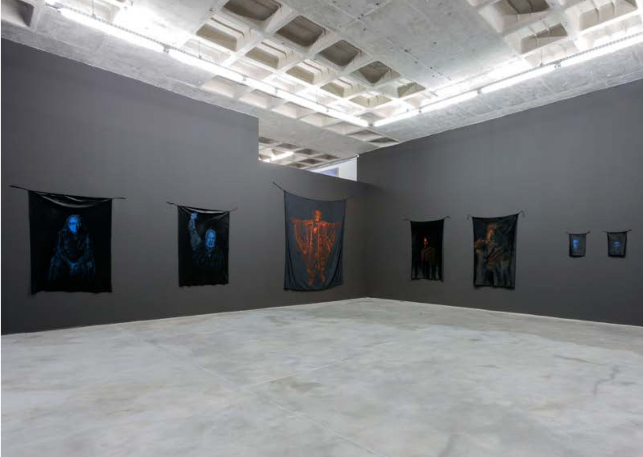
CARINHOSA-CAFUNÉ METAQUILOMBO: MITRE GALERIA, BELO HORIZONTE, 2022