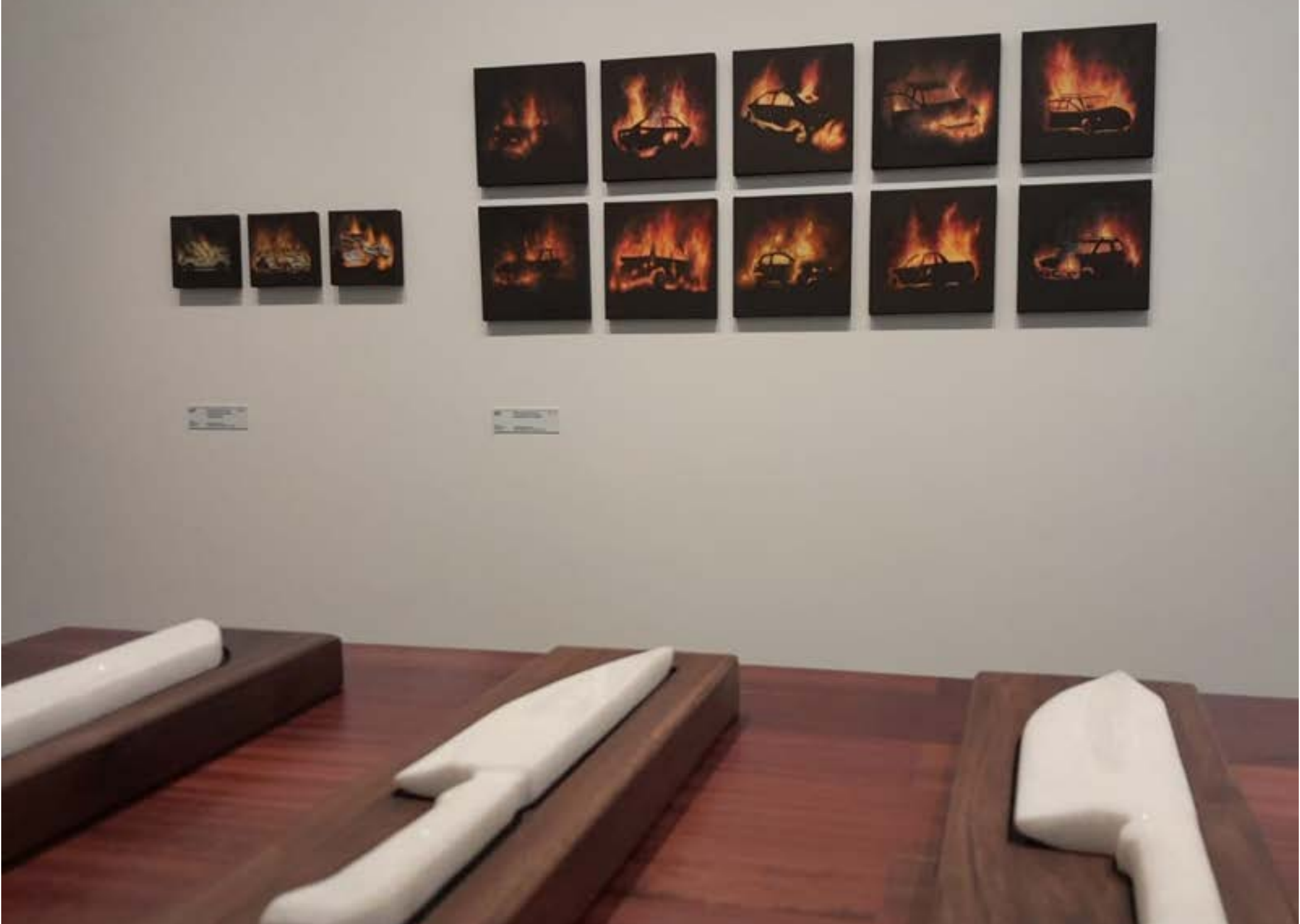
DIREITO À FORMA: INHOTIM, BRUMADINHO, 2023