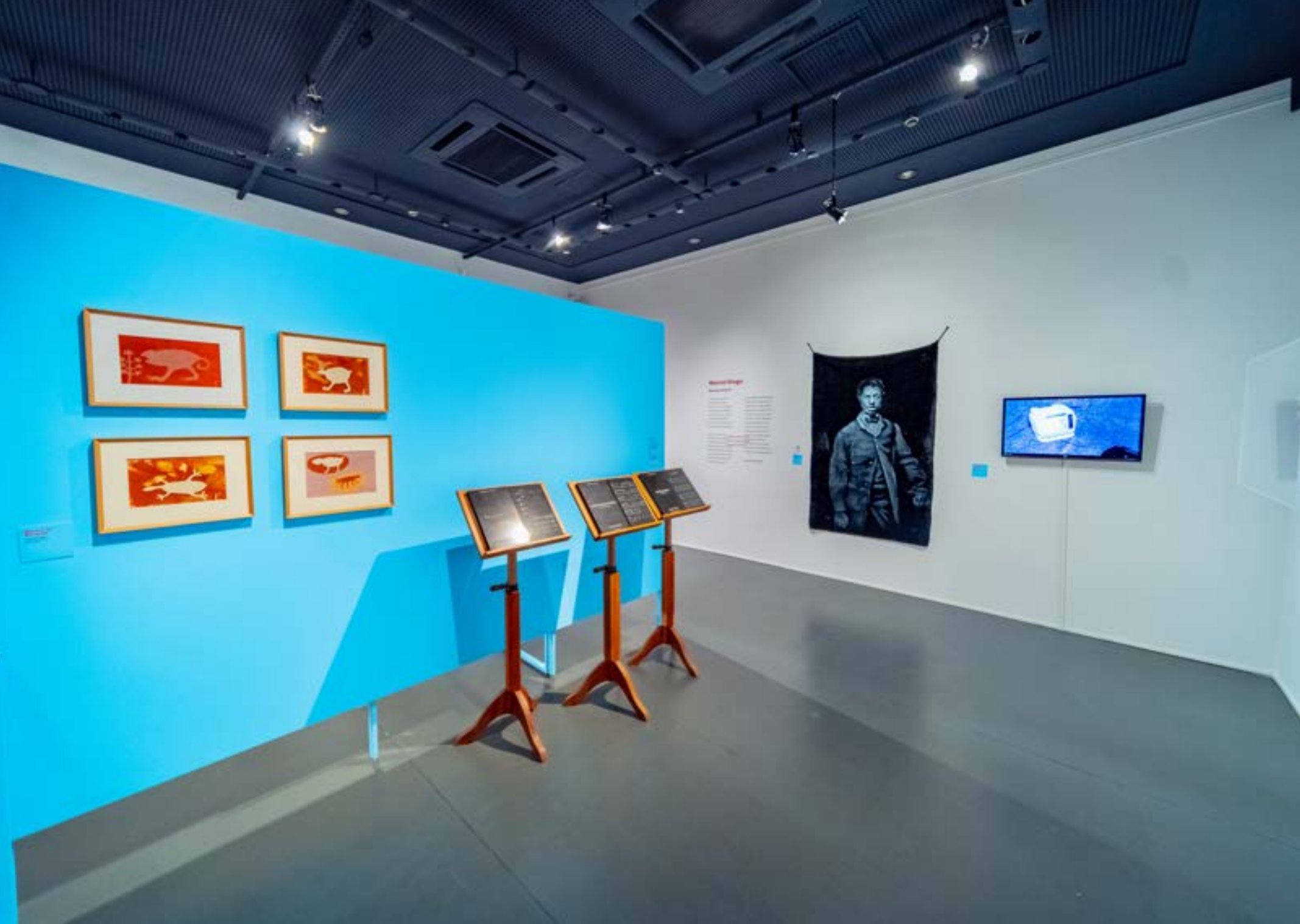
IMAGENS QUE NÃO SE CONFORMAM: MEMORIAL MG, BELO HORIZONTE, 2023