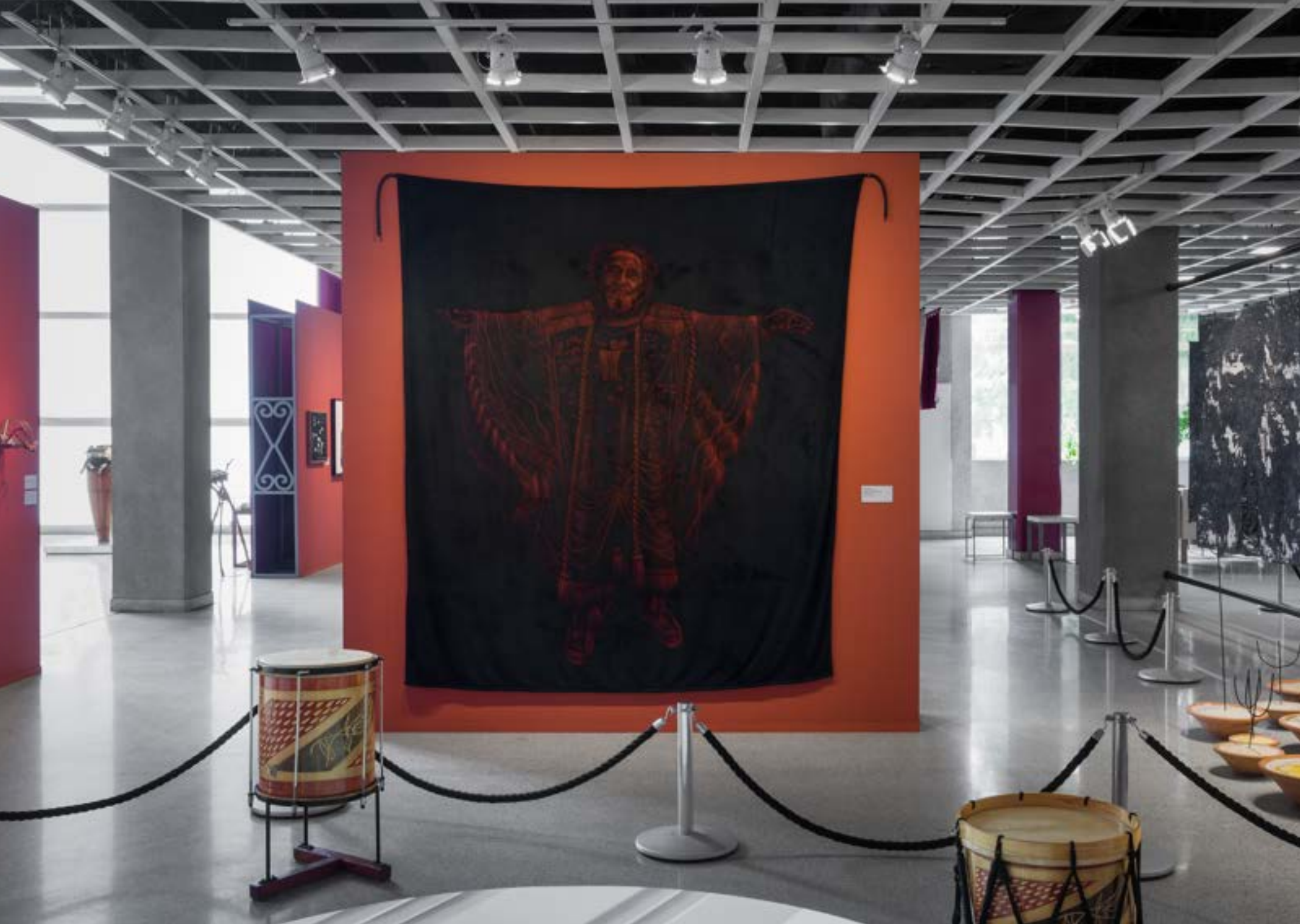
DOS BRASIL: SESC BELENZINHO, SÃO PAULO, 2023