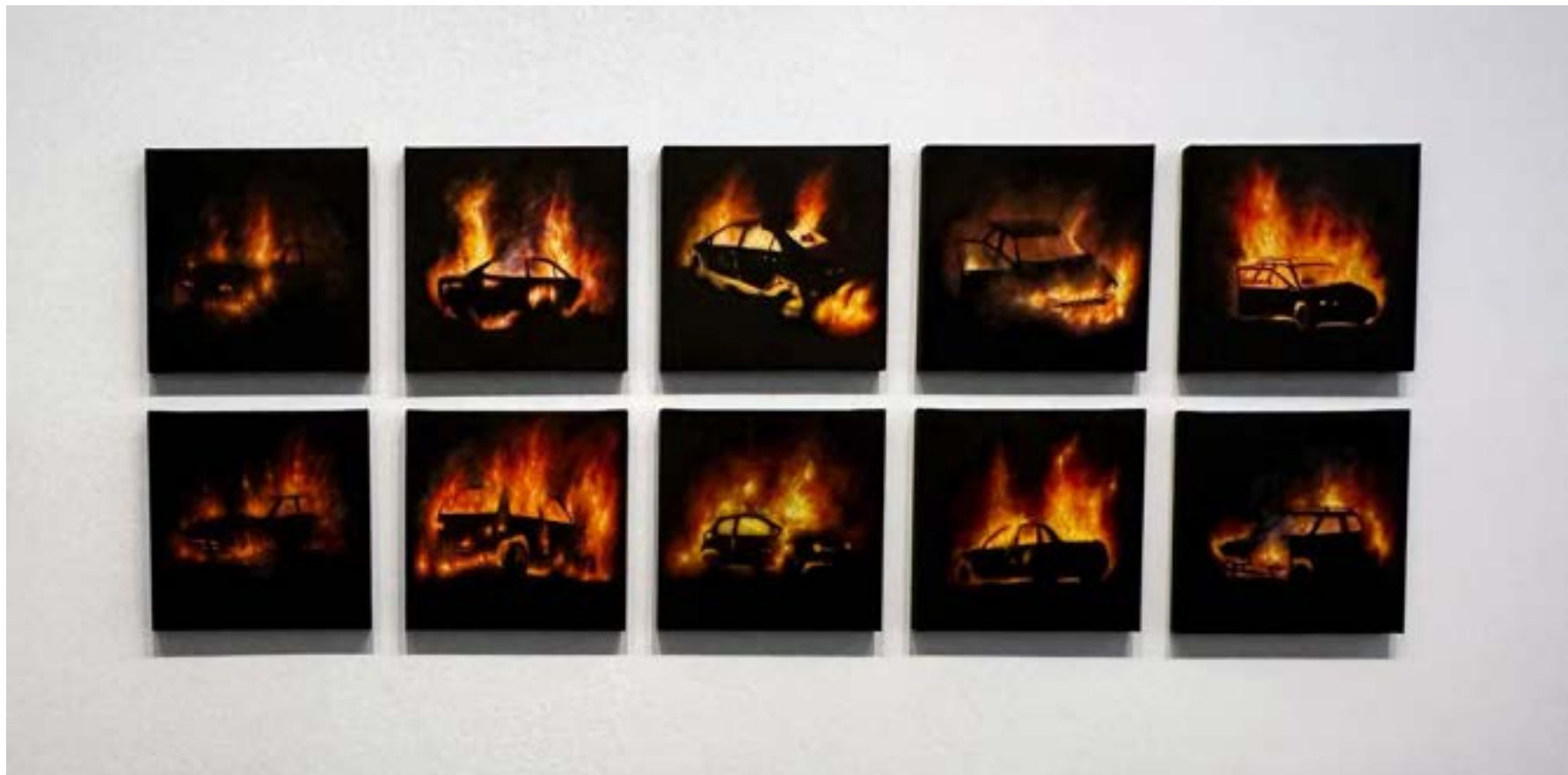
MARCEL DIOGO AQUI TUDO PARECE QUE É PARAÍSO E JÁ É INFERNO 2023 OIL ON CANVAS / ÓLEO SOBRE TELA 30 x 30 CM EACH / CADA