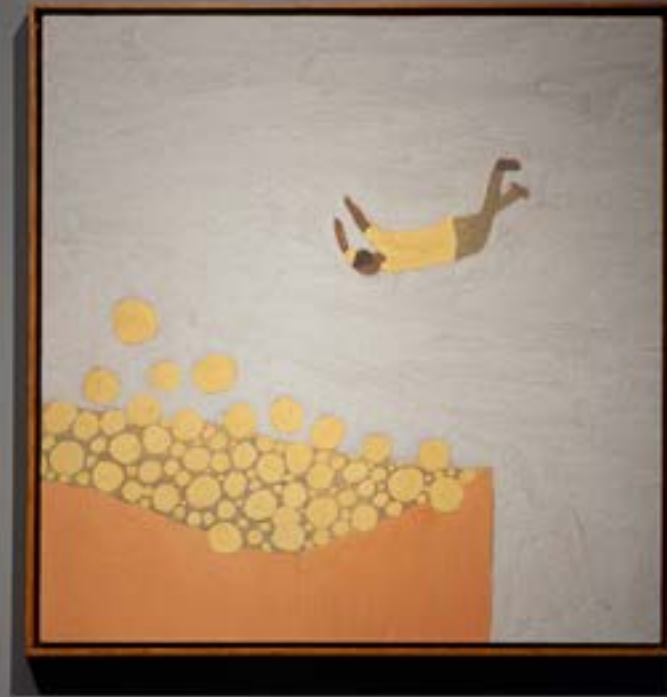
CORPOCONTINENTE: GALERIA PERISCÓPIO, BELO HORIZONTE, 2021