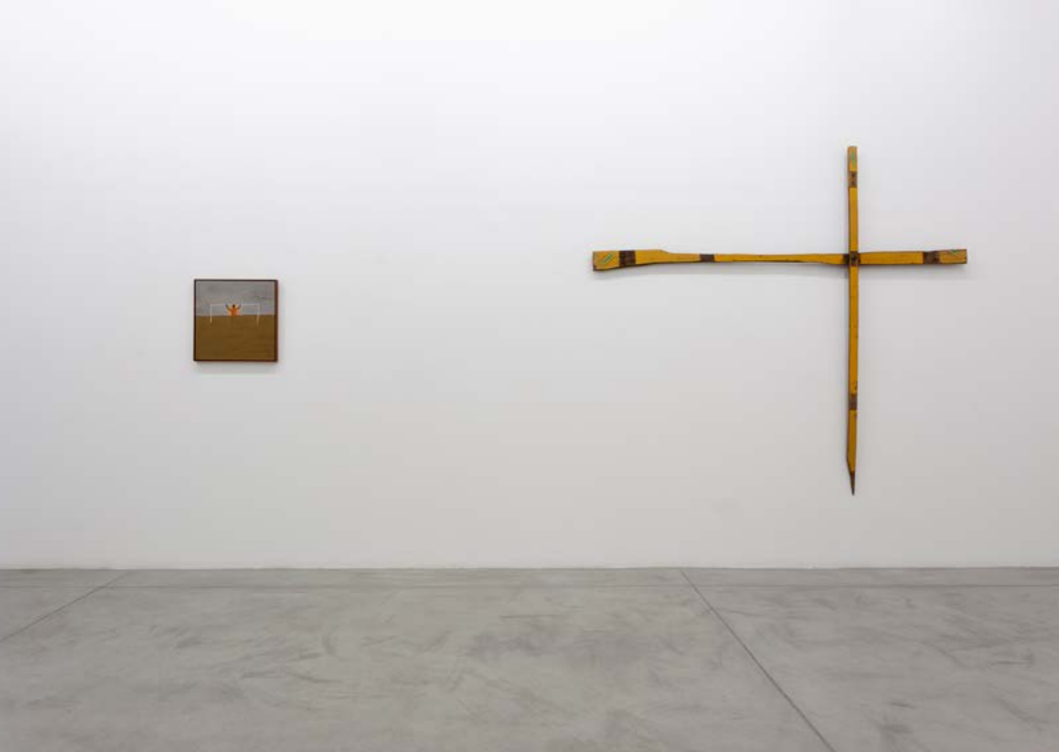
EXTRAÑAR: GALERIA PERISCÓPIO, BELO HORIZONTE, 2022