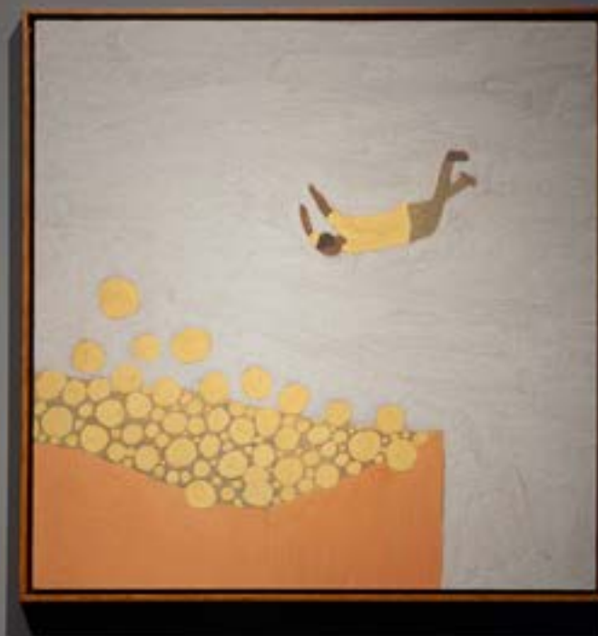
CORPOCONTINENTE: GALERIA PERISCÓPIO, BELO HORIZONTE, 2021