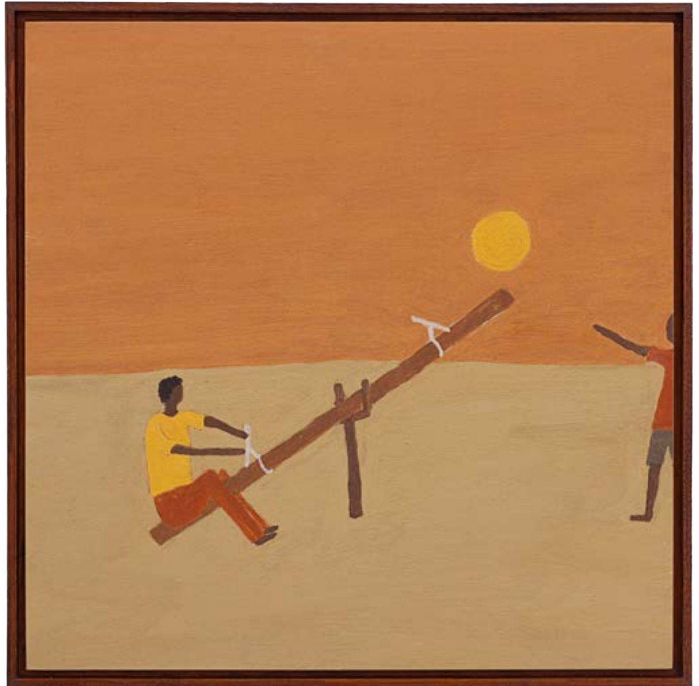
MARCOS SIQUEIRA UNTITLED / SEM TÍTULO 2023 PIGMENT ON WOOD / PIGMENTO SOBRE MADEIRA 50 x 50 CM (PAINTING / PINTURA) 52.5 x 52.5 (FRAMED / EMOLDURADA)