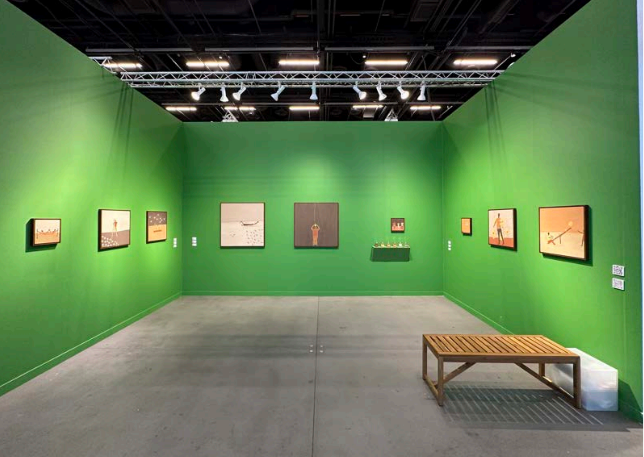
SOLO BOOTH: FRIEZE NY, NEW YORK, 2023