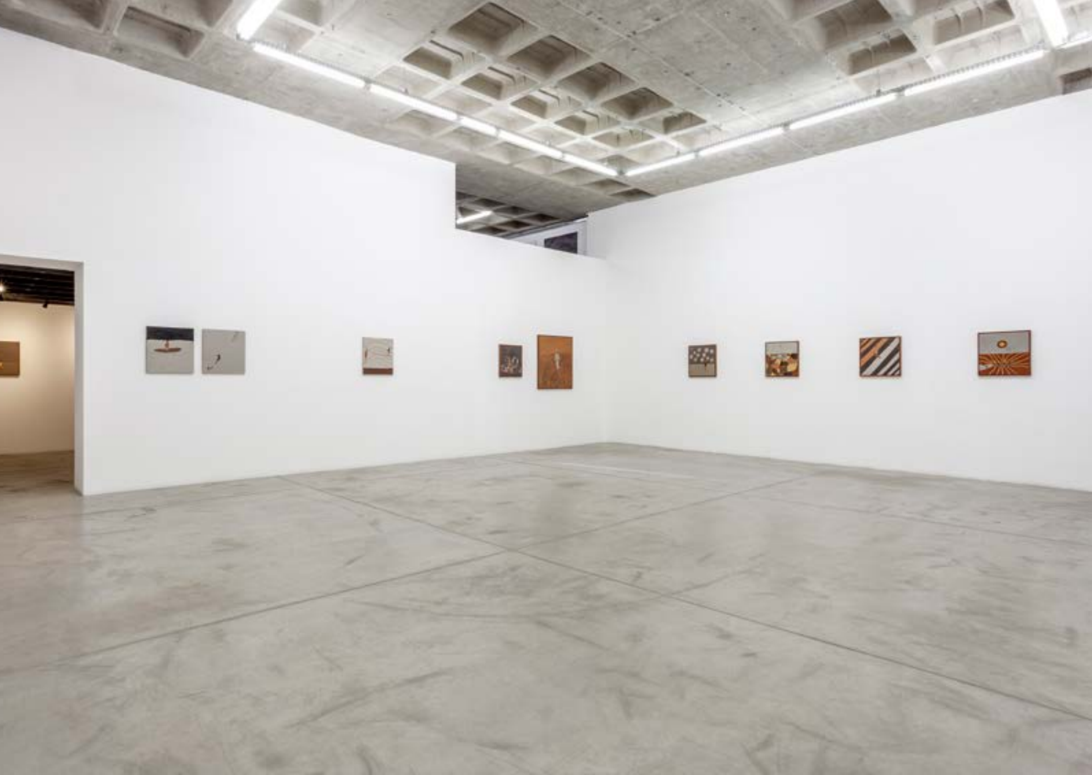
HORIZONTE: GALERIA PERISCÓPIO, BELO HORIZONTE, 2022