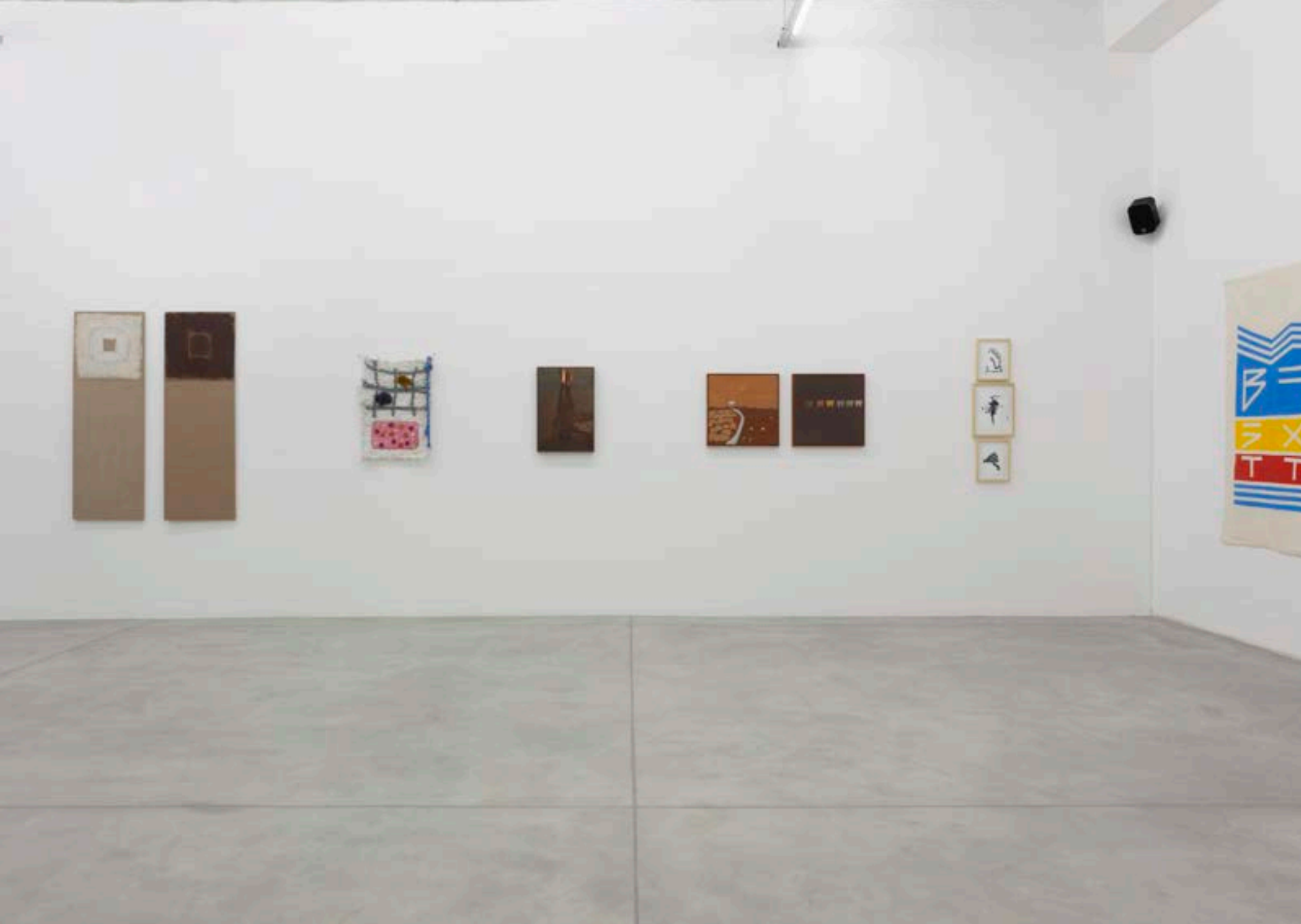
MAA: MITRE GALERIA, BELO HORIZONTE, 2023