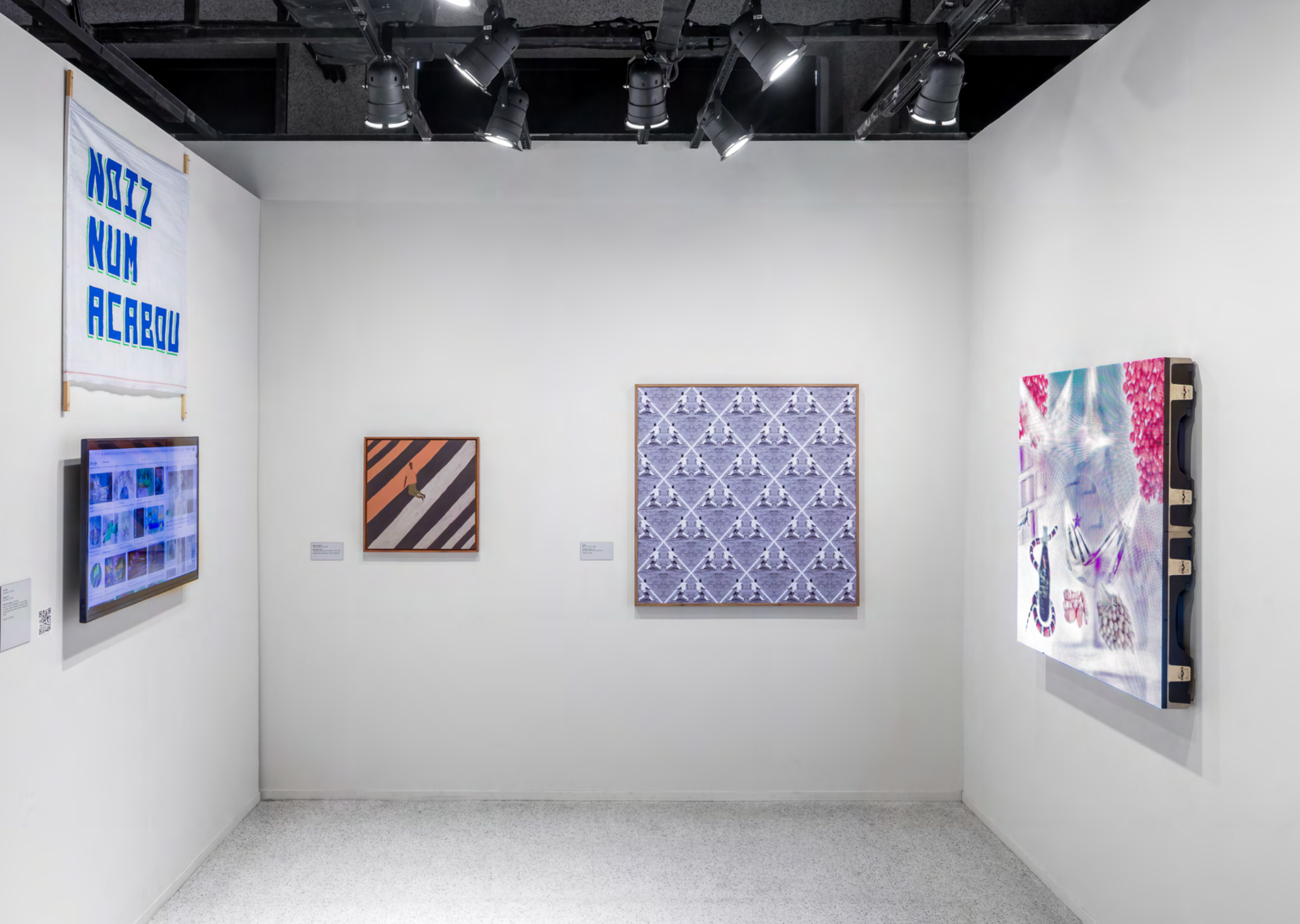
DOS BRASIS: SESC, SÃO PAULO/PETRÓPOLIS, 2023-2024