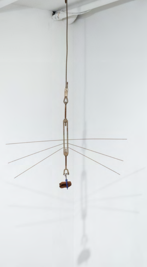
6 ARTISTS: MENDES WOOD DM, NEW YORK, 2023